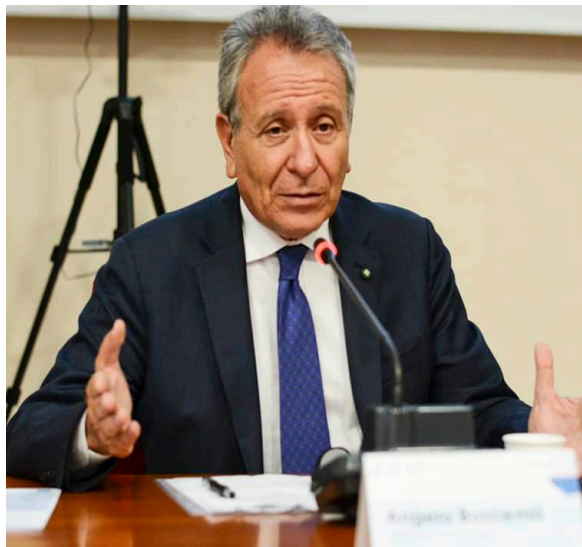
Angelo Buscema - Presidente della Corte dei Conti interviene al Parlamento delle Imprese presso la Camera di Commercio di Cosenza il 13/09/2019

Significativa l'attività svolta in qualità di Magistrato Delegato al controllo ex art. 12 della legge n. 259/1958, presso Enti di grande rilevanza ed elevata complessità a cui lo Stato contribuisce in via ordinaria (Enav, Agenzia Spaziale Italiana, Croce Rossa Italiana). Ai compiti di istituto, ha sempre affiancato attività di docenza e di studio; ha tenuto lezioni e diretto corsi nelle materie giuridiche ed economiche presso Università e scuole di alta formazione professionale. È autore di numerosi volumi ed articoli nelle materie di contabilità e di diritto amministrativo; numerose le sue partecipazioni in convegni su tematiche pubblicistiche.