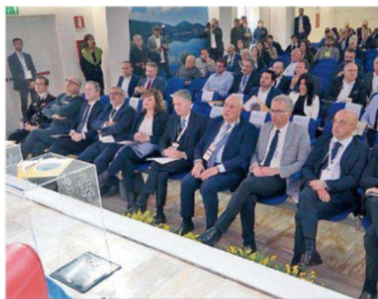
Cosenza Le autorità presenti in sala al Forum del Mezzogiorno