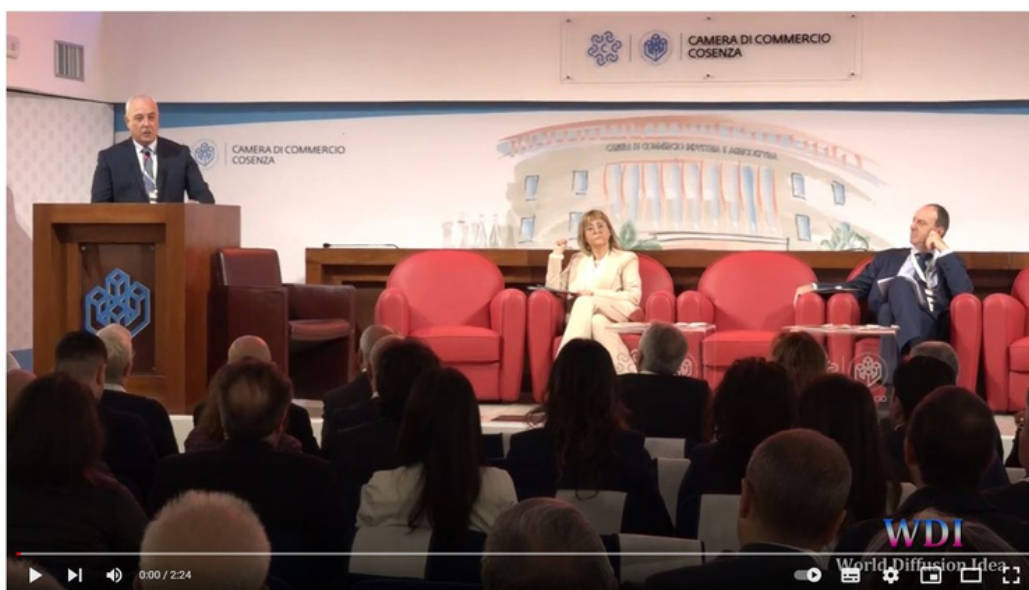
Camera di Commercio di Cosenza: parte il primo Forum del Mezzogiorno "Antonio Serra"