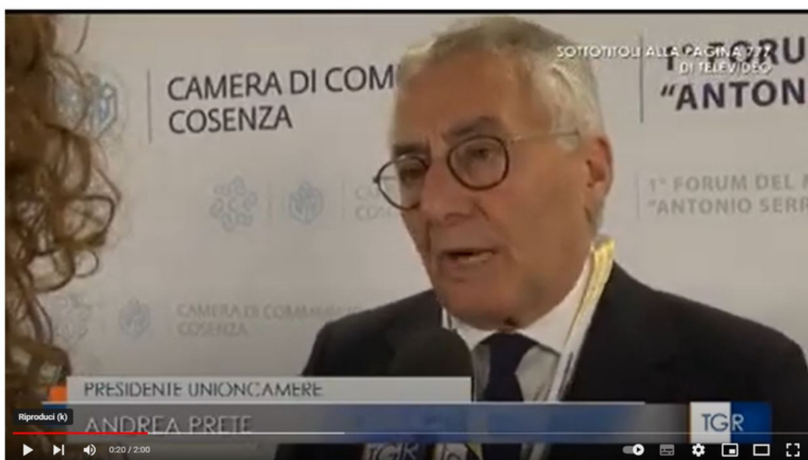
18/05/2023 - RAI 3 TGR Calabria - A Cosenza il primo Forum del Mezzogiorno